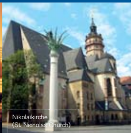
Nikolaikirche (St. Nicholas Church)