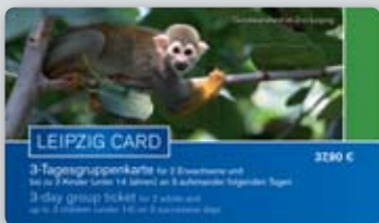
3-Tagesgruppenkarte 37,90 € gültig für 2 Erwachsene und bis zu 3 Kinder (unter 14 Jahren) an 3 aufeinander folgenden Tagen 3-day group ticket €37.90 valid for 2 adults and up to 3 children (under 14) on 3 successive days

The LEIPZIG CARD is just the ticket! Valid for one or three days, and for individuals or groups, the LEIPZIG CARD is the ideal way to explore the city.