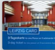
3-Tageskarte 19,90 € gültig für eine Person 3-day ticket €19.90 valid for one person

Auch Leipzig hat seine Welcome Card und die hat es in sich. Ob ein oder drei Tage, ob einzeln oder in Familie, mit der LEIPZIG CARD können Sie die Stadt bequem und vorteilhaft erschließen.