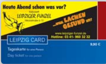
Tageskarte 9,90 € gültig für eine Person Day ticket €9.90 valid for one person