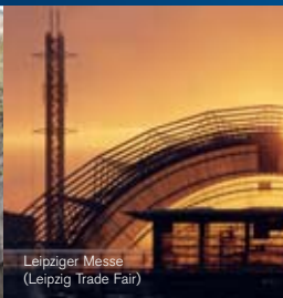
Leipziger Messe (Leipzig Trade Fair)